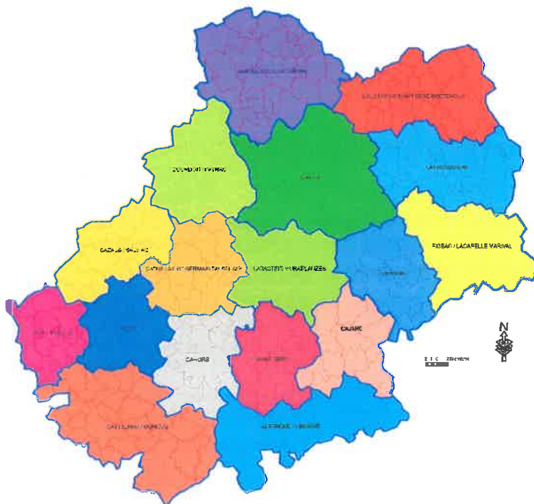
carte UG Sanglier

Le département est divisé en 17 unités de gestion (voir carte ci-dessous). Les territoires ont été définis en commun par l'ensemble des acteurs concernés.